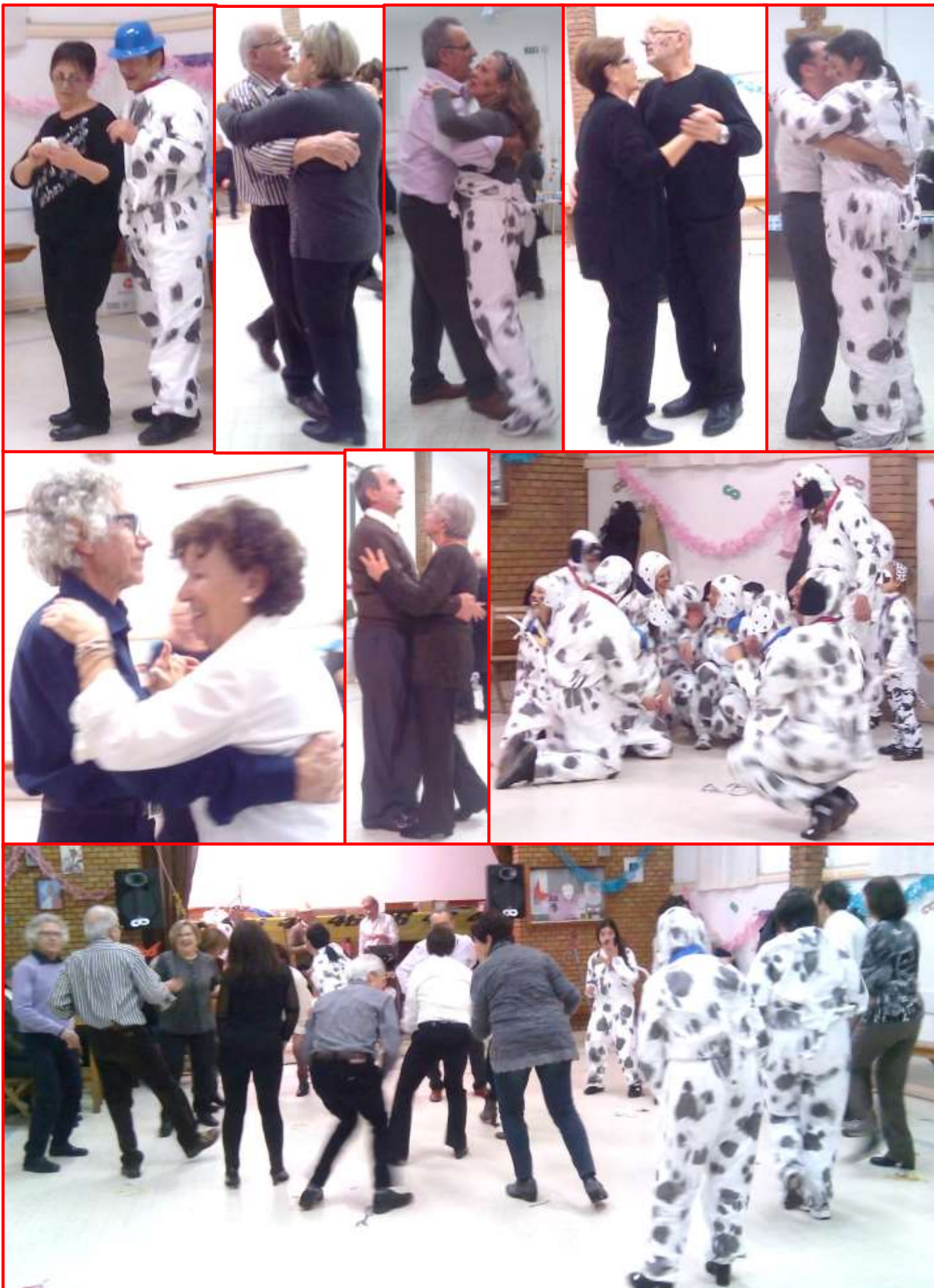
FOTO CARNEVAL CAMPER TAVULLIA