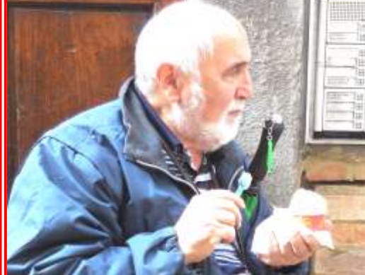
Beccato a sua "insaputa" (come di moda) con il gelato!!!