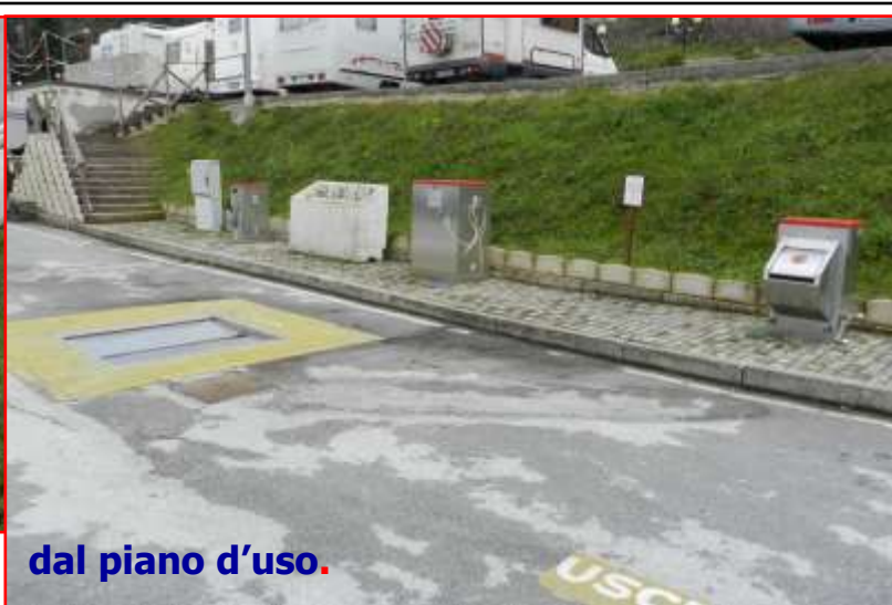
dal piano d'uso.