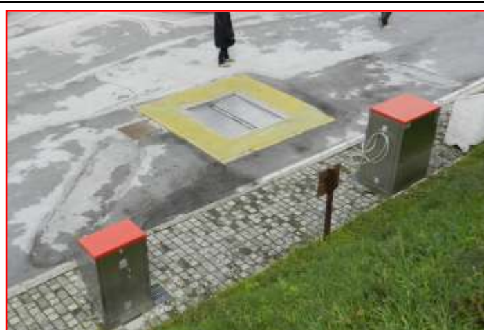
vista dall'alto e.....