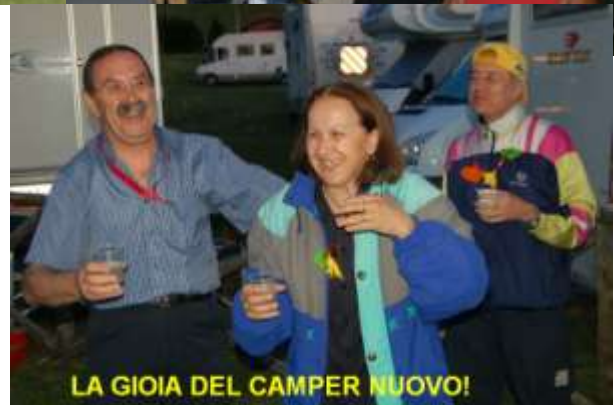
LA GIOIA DEL CAMPER NUOVO!