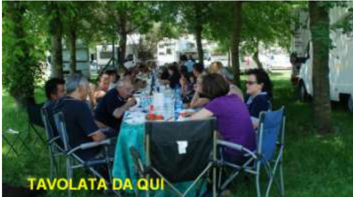
TAVOLATA DA QUI