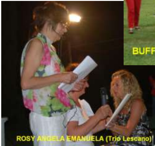
ROSY ANGELA EMANUELA (Trio Lescano)