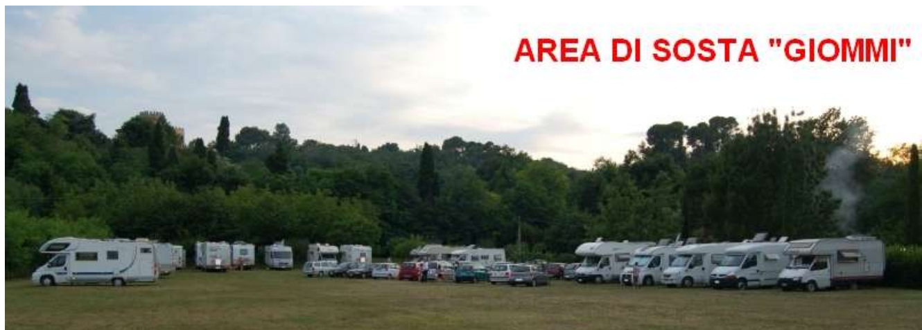
AREA DI SOSTA "GIOMMI"