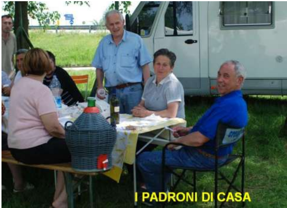
I PADRONI DI CASA