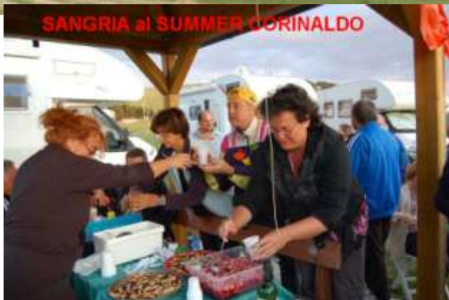
SANGRIA al SUMMER CORINALDO