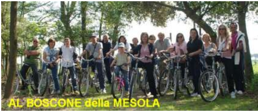
AL BOSCONE della MESOLA