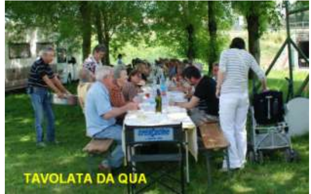
TAVOLATA DA QUA