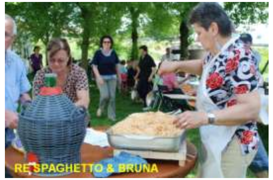
RE'SPAGHETTO & BRUNA