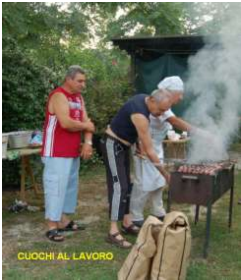
CUOCHI AL LAVORO