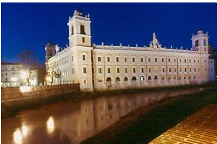
la reggia di Colorno

Un evento irripetibile non solo per gli appassionati ma per quanti vogliono cogliere l'occasione per arricchire il proprio patrimonio culturale.