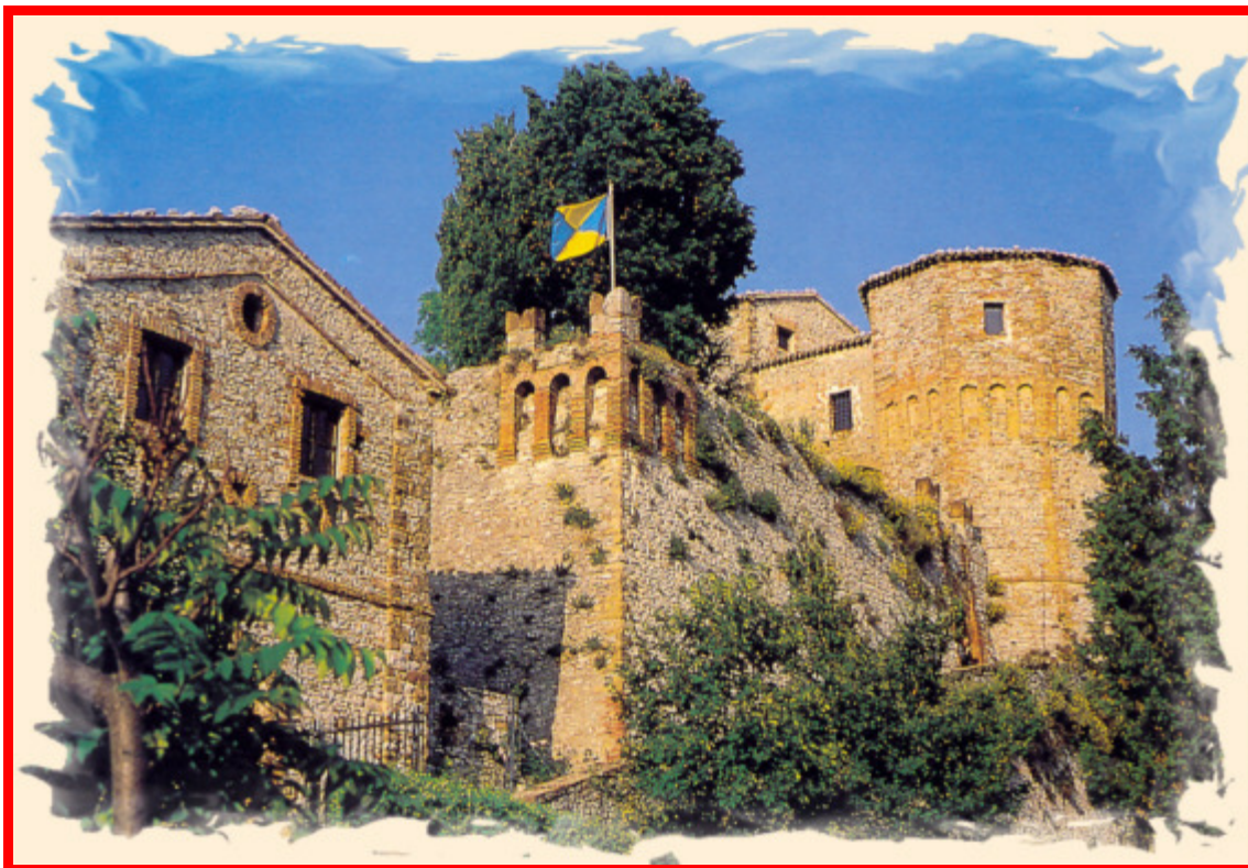
Il castello di Montebello

I sopravvissuti Domenica mattina, dopo una visita a Verrucchio alta, si trasferiranno a Montefiore Conca ove, oltre la visita al Castello o al rinomato Santuario ed al caratteristico mercatino "il più...in più" potranno dedicare il pomeriggio alla castagnata in piazza.