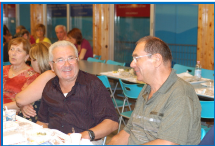
...scene conviviali al Pesce Azzurro