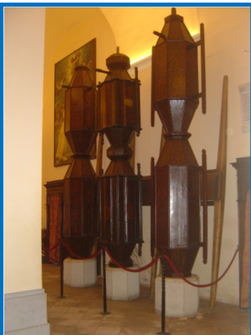
i "ceri" di Gubbio a S.Ubaldo